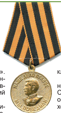
Медаль «За победу над Германией в Великой Отечественной войне 1941-1945 гг.»

9 мая 1960 года состоялось торжественное открытие мемориала в память жертв блокады Ленинграда на Пискаревском кладбище.