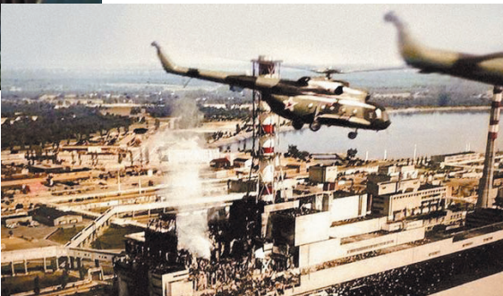
В первые недели после катастрофы в жерло разрушенного реактора было сброшено с вертолетов несколько тысяч тонн карбида бора, свинца и других материалов с целью остановить выброс радиации.