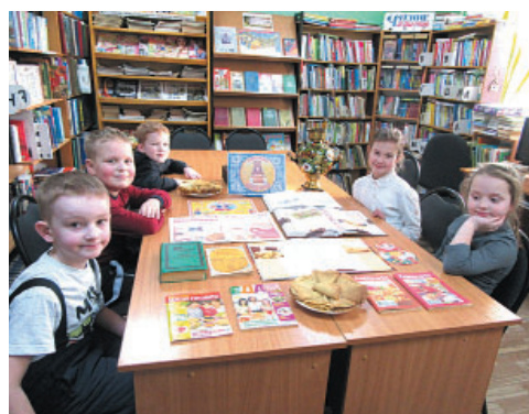
Масленица наполнена теплом, радостью и, конечно же, вкусными блинами!

Для школьников был проведен обзор книжно-иллюстрированной выставки «Широкая масленица», которая знакоит с историей праздника, её традициями и обрядами. В ней представлены книги и журналы с замечательными рецептами блюд масляной недели.