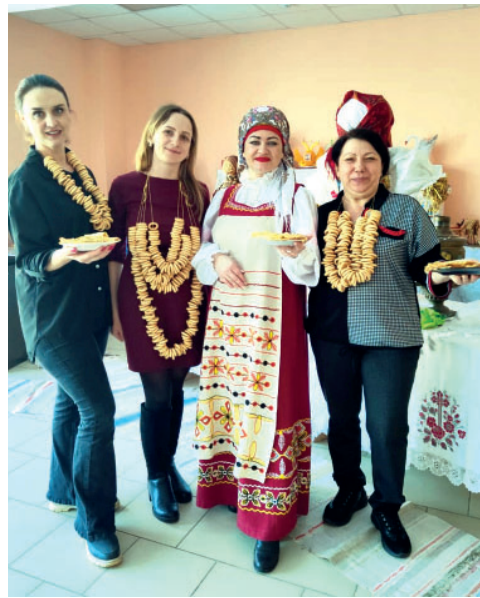
и счастье. Желаем вам и вашим близким здоровья и радостных встреч!

Пусть с первыми солнечными днями в каждый дом придут удача, смех и радость, достаток