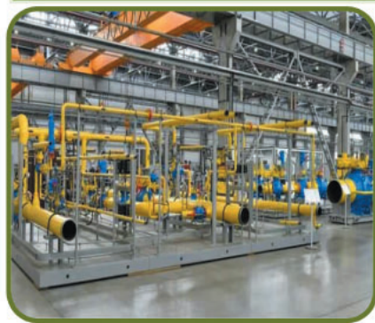
ООО «ГазЭнергоКомплект», с.Глинищево, вторая очередь строительства