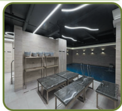
ООО «Сибирские бани», строительство оздоровительного центра в п.Путевка