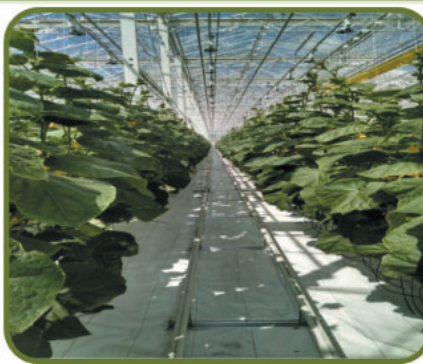
ООО Тепличный комбинат «Журиновичи», с.Журиновичи, вторая очередь строительства