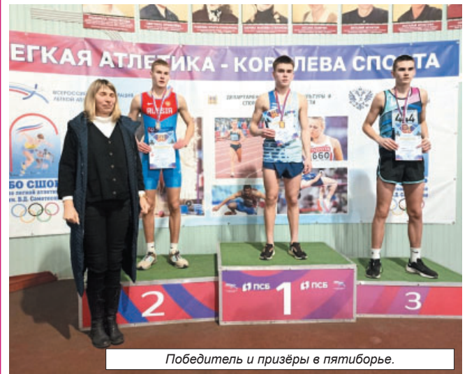
Победитель и призеры в пятиборье.

В легкоатлетическом марафоне имени В.Д. Самотесова прошло первенство Брянской области по легкоатлетическим многоборьям в помещении среди юношей и девушек. В соревнованиях приняло участие около 200 спортсменов из спортивных школ Брянской области.