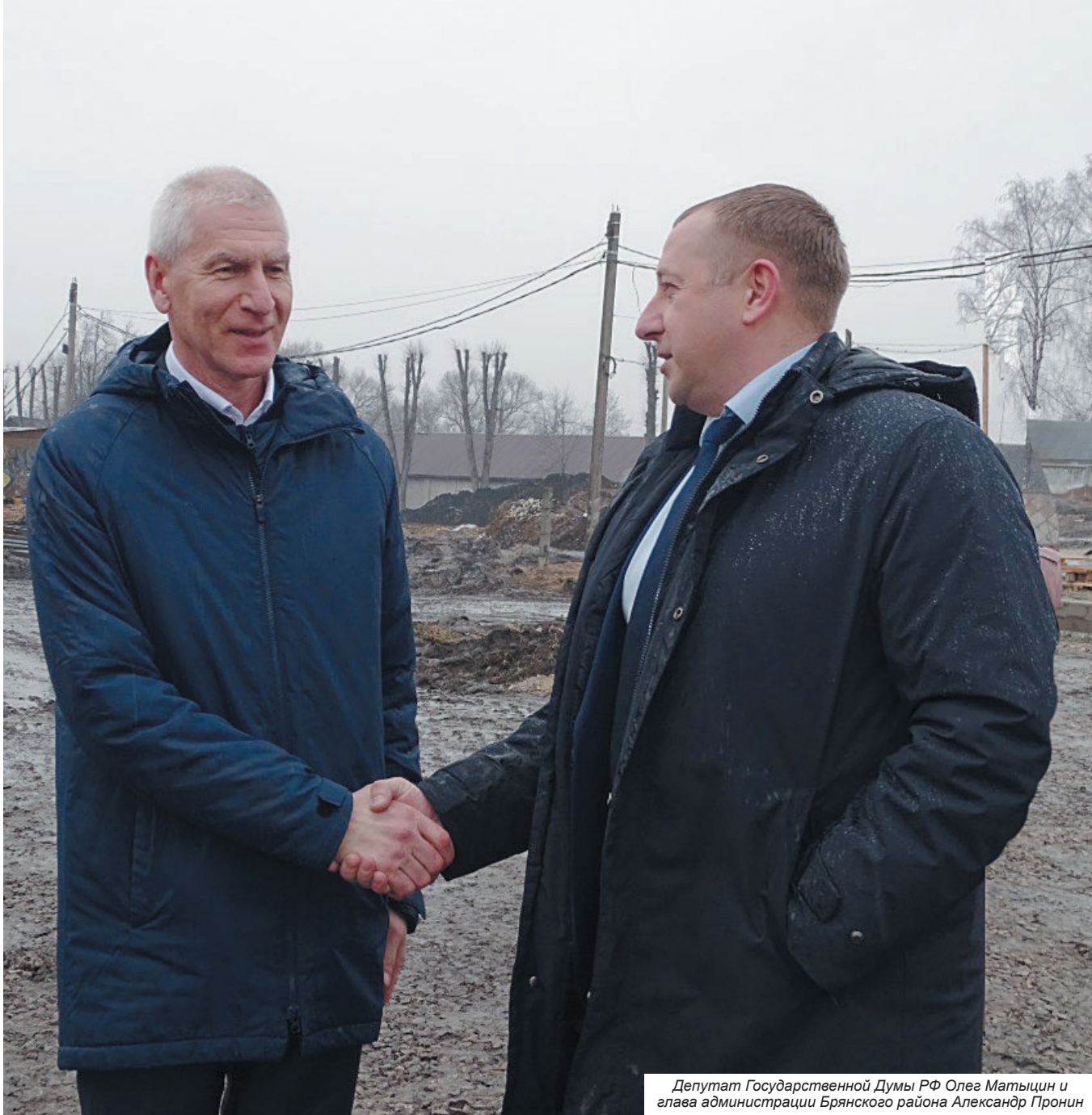
Депутат Государственной Думы РФ Олег Матыцин и глава администрации Брянского района Александр Пронин

Депутат Государственной Думы Олег Матыцин посетил Брянский район