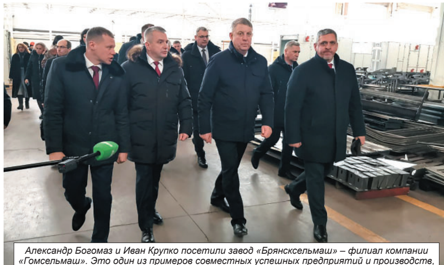
Александр Богомаз и Иван Крупко посетили завод «Брянсксельмаш» — филиал компании «Гомсельмаш». Это один из примеров совместных успешных предприятий и производств, интеграции России и Белоруссии