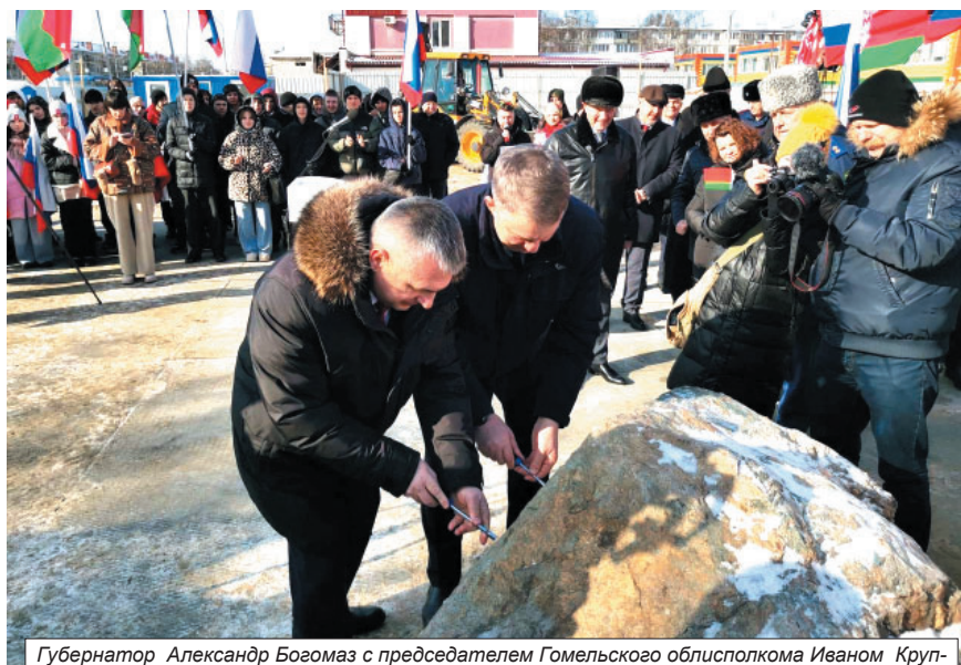
Губернатор Александр Богомаз с председателем Гомельского облисполкома Иваном Крупко заложили первый камень в строительство второго многоквартирного дома в Брянске

при увеличении производства полностью локализованной техники.