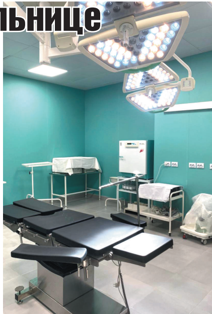
Брянская межрайонная больница обновилась и готова к очередным высотам в оказании качественной и своевременной медицинской помощи населению!

Таким образом, благодаря программе модернизации первичного звена здравоохранения, практически все значимые принципиальные позиции оказались укомплектованы современным оборудованием, что немаловажно — российского производства, а это означает отсутствие проблем с запчастями и комплектующими.