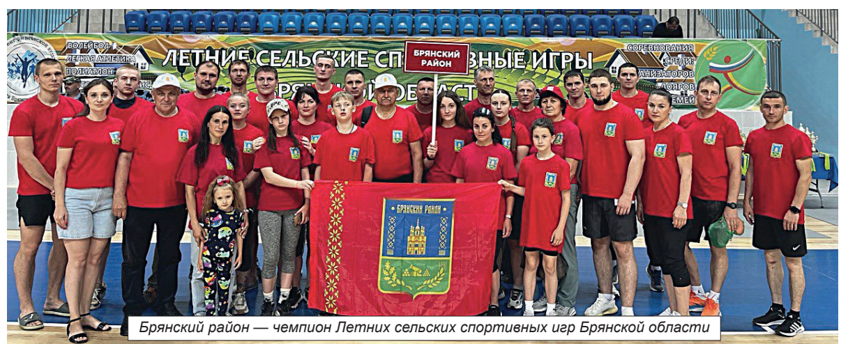
Брянский район — чемпион Летних сельских спортивных игр Брянской области