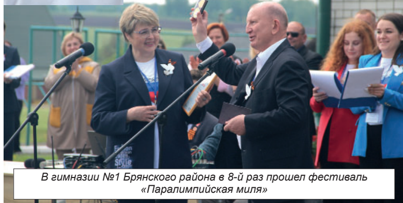
В гимназии №1 Брянского района в 8-й раз прошел фестиваль «Паралимпийская миля»