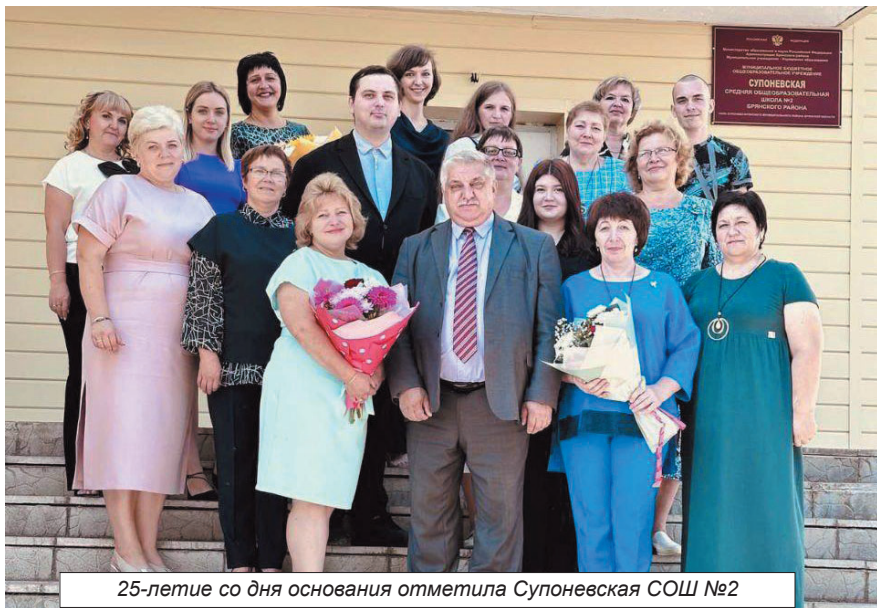
25-летие со дня основания отметила Супоневская СОШ №2

Во второй половине года Сатурн и Нептун поменяют знак и войдут в сектор финансов. С июля по октябрь благоприятное положение Юпитера будет способствовать увеличению доходов, получению финансовой выгоды. Предыдущие старания и усилия на работе принесут хорошие результаты: это может быть как продвижение в карьере, так и улучшение в материальном плане. Но если прежде вы не проявляли упорства и усердия в работе, то есть риск столкнуться с разочарованием, а также необходимостью пересмотреть свои цели.