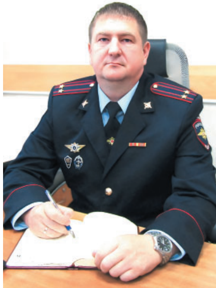
бу в полицию молодые люди?

– Связать жизнь с профессией полицейского решается далеко не каждый. Труд стража правопорядка тяжел и порой очень опасен, требует специальных знаний и хорошей физической подготовки, а так же служба связана с определенными ограничениями и запретами, которые действуют для сотрудника после работы.