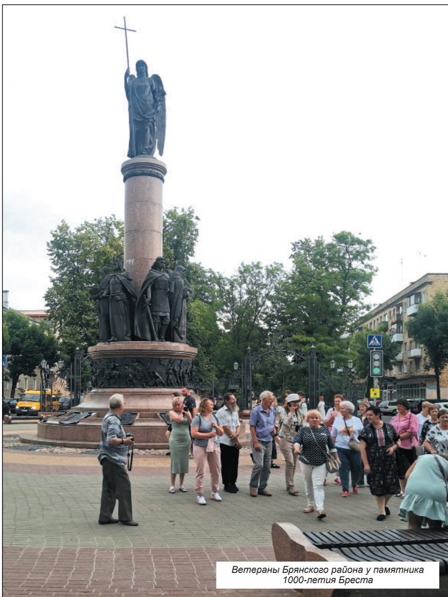
Ветераны Брянского района у памятника 1000-летия Бреста