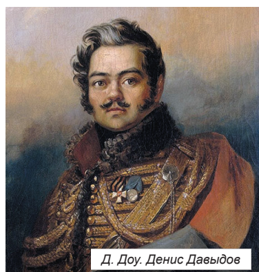
Д. Доу. Денис Давыдов

2. Хотя юноша грезил военной службой, сперва его наотрез отказались принимать в полк кавалергардов из-за слишком маленького роста. Кстати, свой невысокий рост вконец с курносый носом, и сам Денис Васильевич воспринимал очень болезненно, однако впоследствии этот недостаток никто не замечал. В