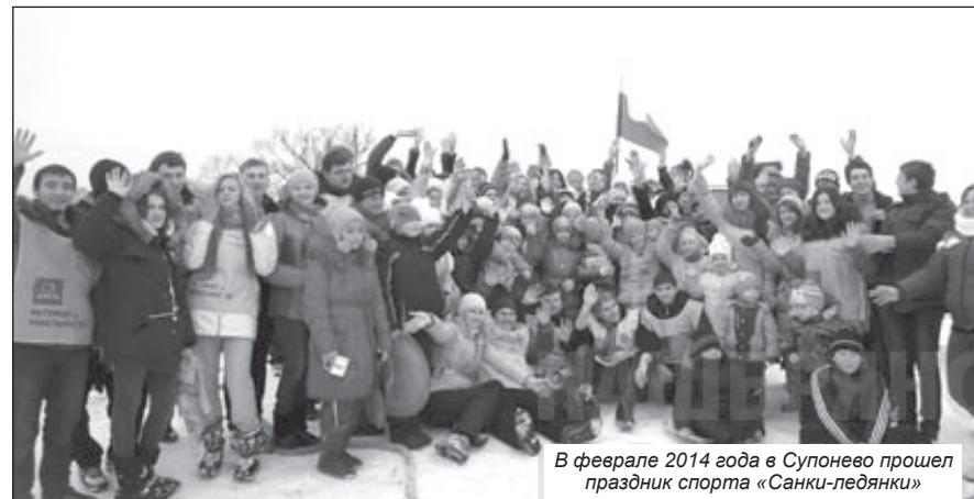
В феврале 2014 года в Супоневе прошел праздник спорта «Санки-ледянки»

1 февраля 2014 года Мичуринская школа отметила 50-летний юбилей. На мероприятии в учебном заведении собрались выпускники, учителя, бывшие педагоги, учащиеся и их родители. Не забыли никого!