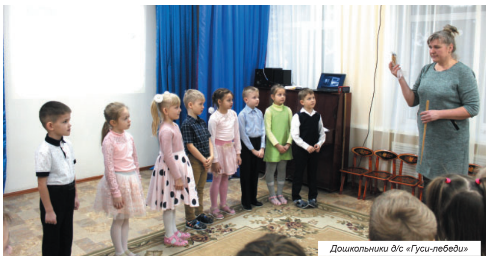
Дошкольники д/с «Гуси-лебеди»