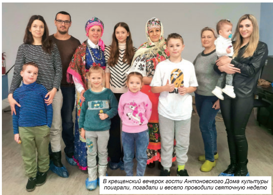
В крещенский вечерок гости Антоновского Дома культуры поиграли, погадали и весело проводили святочную неделю