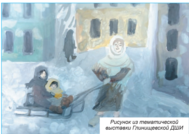
Рисунок из тематической выставки Глинищевской ДШИ