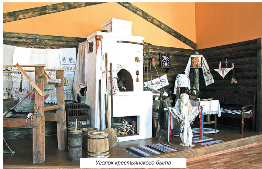
Уголок крестьянского быта

— Несмотря на разнообразие экспозиций нашего музея, есть тема, которую мы, буквально с первых дней возобнов-