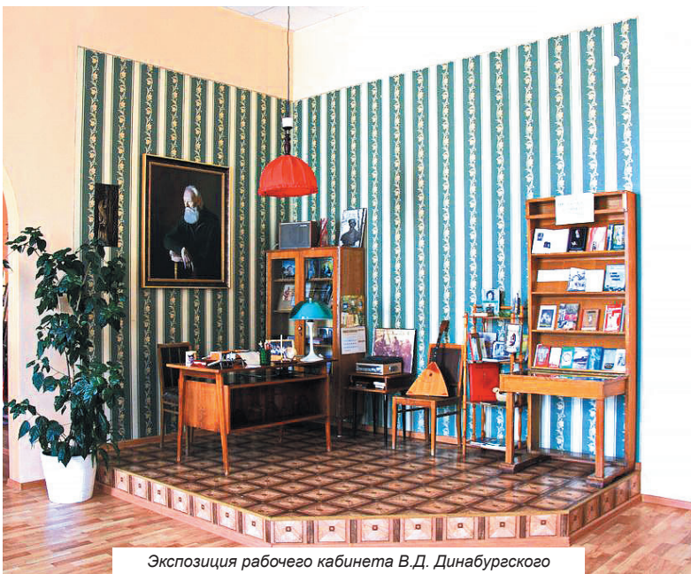
Экспозиция рабочего кабинета В.Д. Динабургского