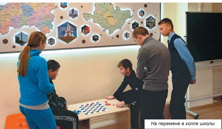
На перемене в холле школы