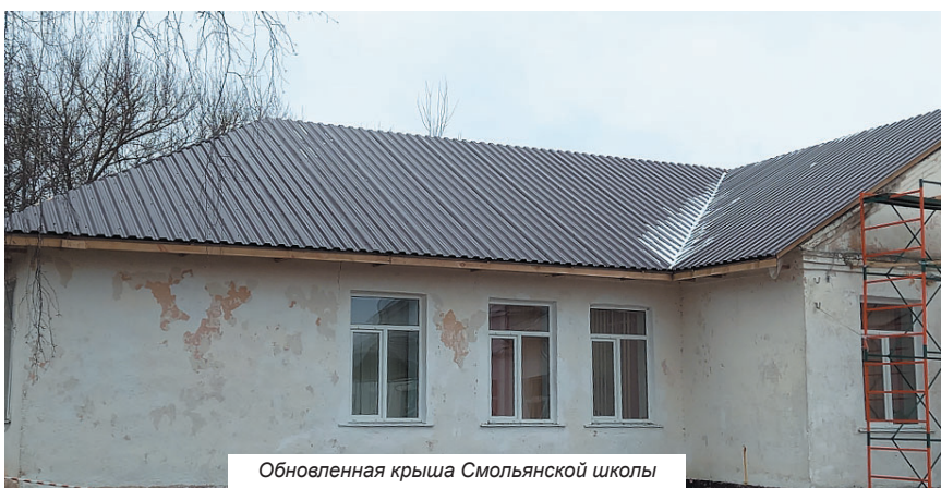
Обновленная крыша Смольнянской школы

Добрунская сельская администрация просит считать не опубликованным извещение о проведении аукциона на право заключения договора купли-продажи земельного участка с кадастровым номером 32:02:0250714:80, размещенного в газете Деснянская правда №46(9407) от 24.11.2023г.(основание: п. 3 ст. 39.13.Земельного кодекса Российской Федерации).