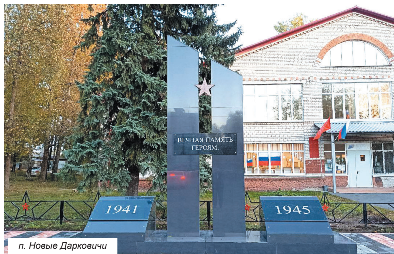
п. Новые Дарковичи

для цветов. По периметру высажены туи и лежачий можжевельник. По