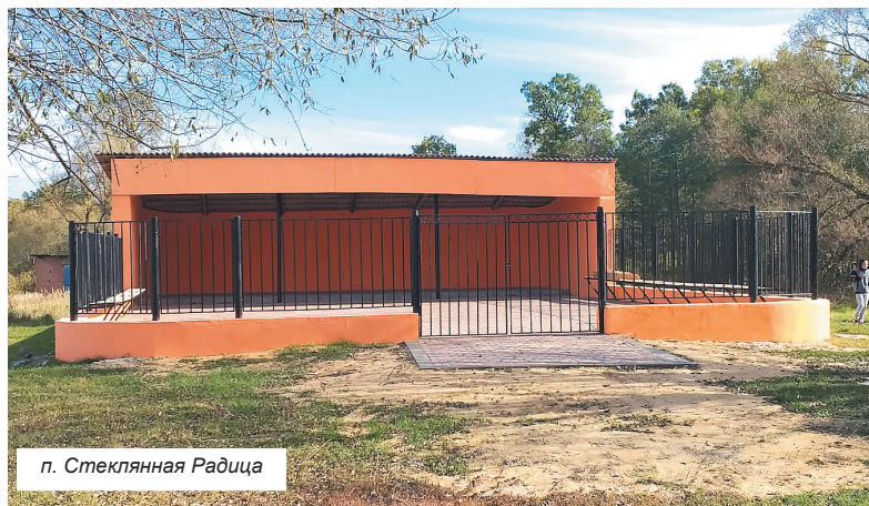
п. Стеклянная Радица

Реализация проекта позволила придать памятнику и территории вокруг него вид, достойный памяти