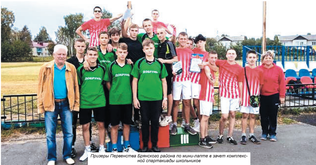
Призеры Первенства Брянского района по мини-лапте в зачет комплексной спартакиады школьников