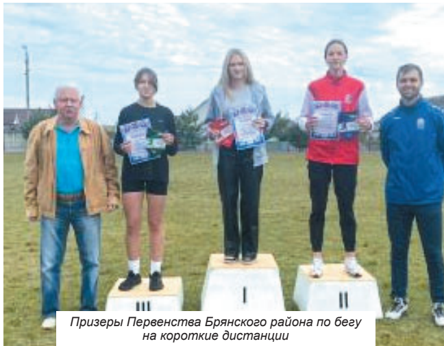
Призеры Первенства Брянского района по бегу на короткие дистанции