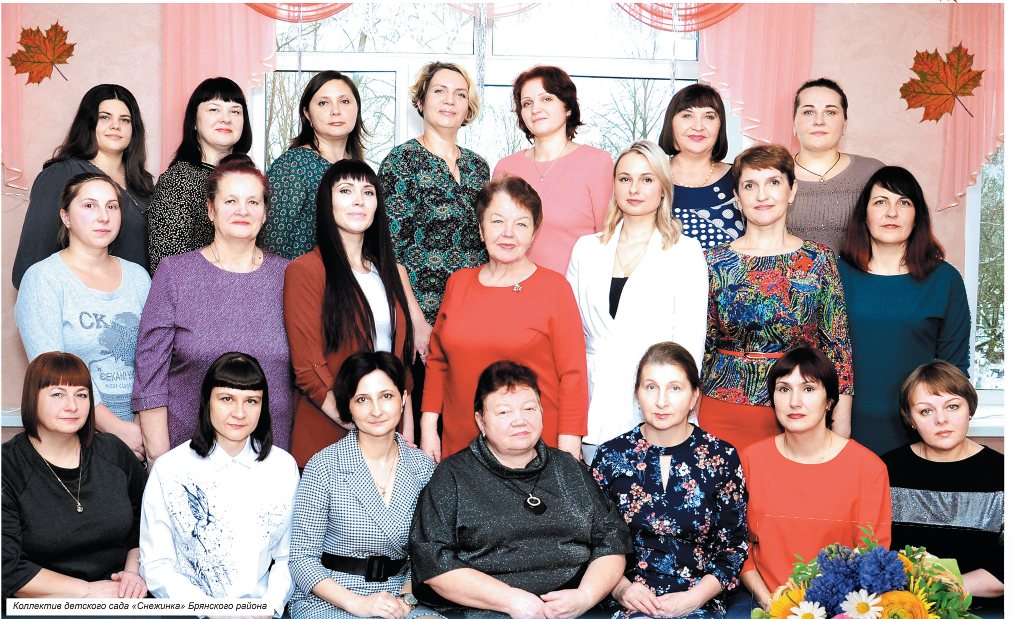
Коллектив детского сада «Снежинка» Брянского района

27 сентября — День воспитателя и всех дошкольных работников