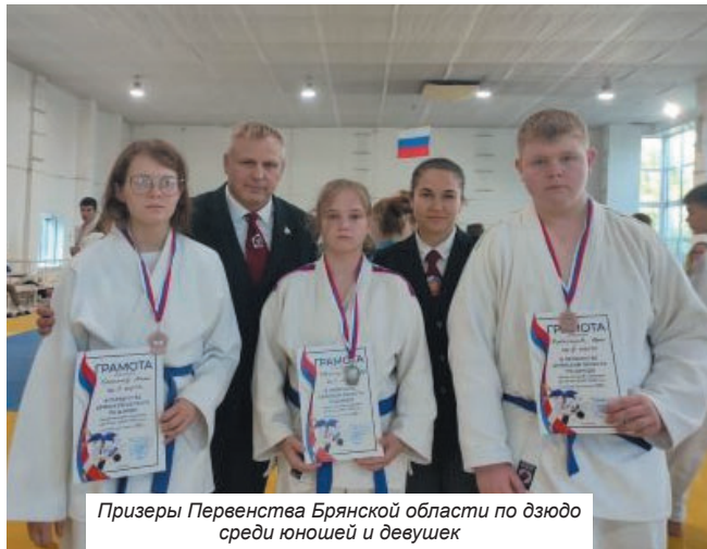
Призеры Первенства Брянской области по дзюдо среди юношей и девушек

на» в д.Добрунь прошло первенство Брянского района по мини-лапте в зачет комплексной спартакиады школьников 2023-2024 уч.г. В соревнованиях приняли участие около 130 учащихся из 9 школ района (9 команд юношей и 6 команд девушек). У девушек I место - МБОУ «Снежская гимназия»; II место - МБОУ «Отраденская СОШ»; III место - МБОУ «Гимназия №1 Брянского района». Среди команд юношей I место - МБОУ «Лицей №1 Брянского района»; II место - МБОУ «Гим-