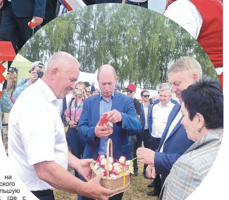
О посещении Губернатором А.В. Богомазов подворья Брянского района на «Дне Брянского поля-2023» читайте на 3-й стр.

ласти. Они постарались на славу. Фермеры из Брянского района представили небольшую птицеводческую фабрику, где с невозмутимыми гусями соседствовали куры и другие пернатые. Брасовцы привезли с собой соломенную лошадь и целый колодец с квасом, который изготовил для гостей главач Веребского поселения. Здесь же многие отведали разнообразные сыры местного предприятия, а также послушали песни голосистых мастериц и могли пообщаться с грациозными девушками-наезд-