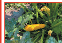
участках. На одном из них - в Добрунском лицее - побывал корреспондент «Деснянской правды».