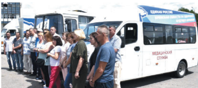
«Медицинский десант» встречают в Брянке