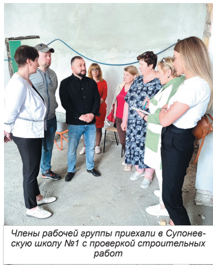
Члены рабочей группы приехали в Супоневскую школу №1 с проверкой строительных работ