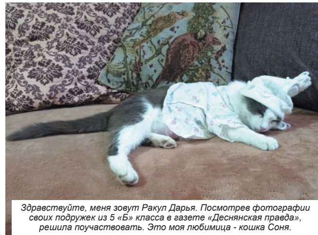
Здравствуйте, меня зовут Ракул Дарья. Посмотрев фотографии своих подружек из 5 «Б» класса в газете «Деснянская правда», решила поучаствовать. Это моя любимица - кошка Соня.