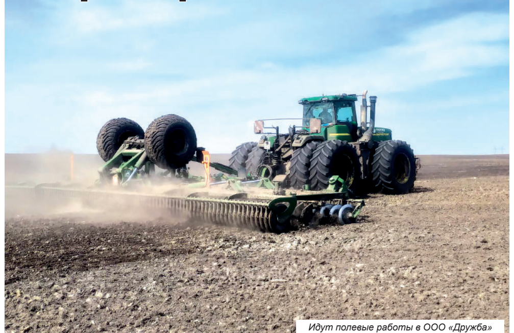
Идут полевые работы в ООО «Дружба»

Как сообщили в управлении сельского хозяйства, посевная площадь сельскохозяйственных культур в 2023 году составит 21518 га. Посевы зерновых и зернобобовых культур запланированы на площади 11248 га, в том числе озимые зерновые - 3772 га. Яровые посевы займут 14396 га. В том числе: яровые зерновые и зернобобовые - 2952 га, кукуруза на зерно - 4524 га, картофель - 1913 га, овощи открытого грунта - 150 га, рапс яровой - 1946 га, кормовые культуры - 2911 га.