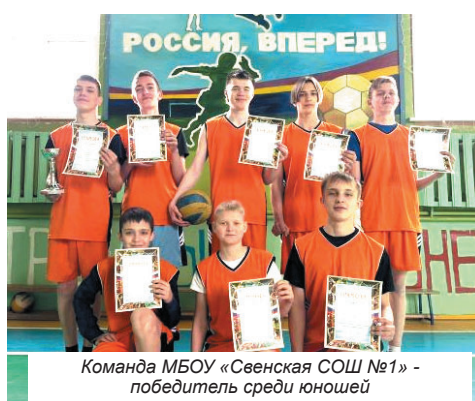
Команда МБОУ «Свенская СОШ №1» - победитель среди юношей

У девушек за победу боролись: Отрадненская СОШ, Новодарковичская СОШ и Лицей №1. В упорной борьбе места распределились следу-