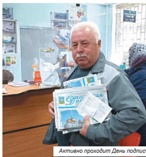
Активно проходит День подписчика в Добрунском отделении связи

В Мичуринском от наших глаз не скрылось приятное обновление почтового отделения. В помещении установили новые стойки и стеллажи, которые создали большую открытость и удобство, как для сотрудников, так и для посетителей. Пообщавшись с жителями Мичуринского поселения, мы еще раз убедились, что,