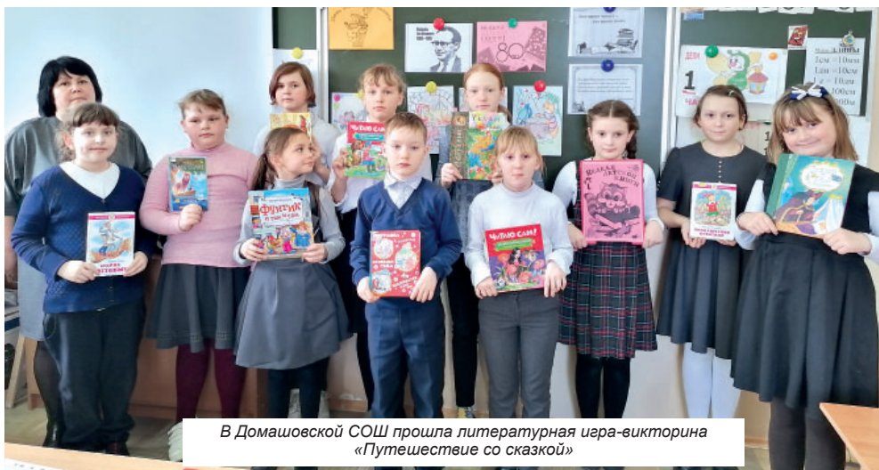
В Домашовской СОШ прошла литературная игра-викторина «Путешествие со сказкой»

В 2023 году исполняется 80 лет неделе детской книги – празднику всех читающих ребят, празднику детства, радости и встреч с любимыми книгами.