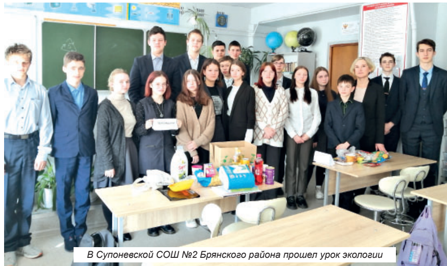
В Супоневской СОШ №2 Брянского района прошел урок экологии

Опасные отходы, лампы и батарейки, нужно собирать в отдельную коробку. Лампы необходимо сдать в управляющую компанию, а отработанные батарейки отнести в