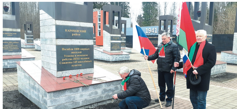
Члены белорусского землячества почтили память белорусской Хатыни на мемориале «Хацунь» под Брянском

Но объединяющих факторов намного больше, и они есть и на уровне государства — совместные проекты, предприятия во всех сферах экономики, в образовании, а в личном плане —