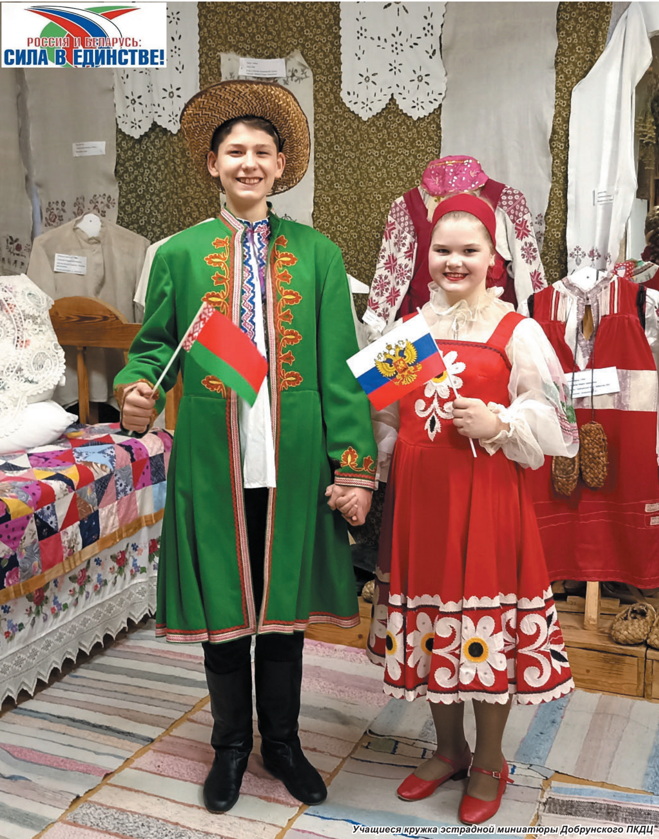
Учащиеся кружка эстрадной миниатюры Добрунского ПКДЦ