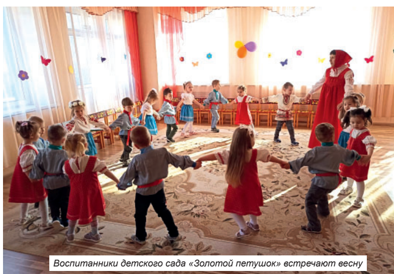
Воспитанники детского сада «Золотой петушок» встречают весну

В дошкольном возрасте необходимо приобщать детей к культуре