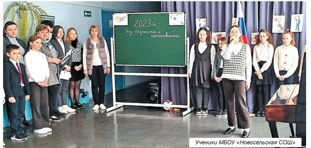
Ученики МБОУ «Новосельская СОШ»