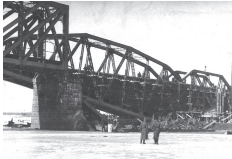
Архивные фото.