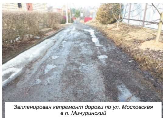
Запланирован капремонт дороги по ул. Московская в п. Мичуринский

Так, будут отремонтированы автомобильная дорога по улице Московской в посёлке Мичуринский и участок автомобильной дороги по улице Московской в селе Супонево. В настоящее время проходит процедура определения подрядной организации по выполнению дорожно-ремонтных работ.