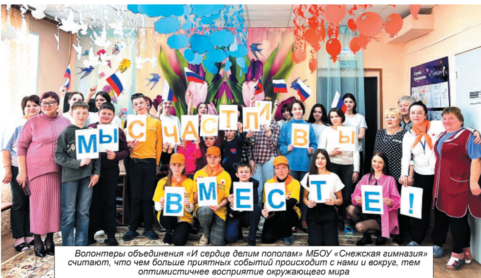
Волонтеры объединения «И сердце делим пополам» МБОУ «Снежская гимназия» считают, что чем больше приятных событий происходит с нами и вокруг, тем оптимистичнее восприятие окружающего мира

Волонтеры объединения «И сердце делим пополам» Снежской гимназии Брянского района 20 и 21 марта провели масштабную акцию к празднику «Международному дню счастья».