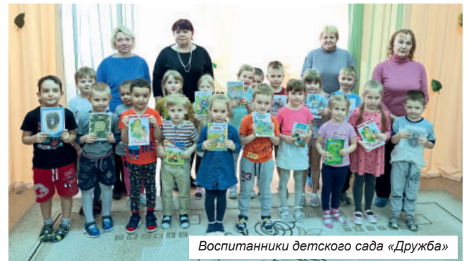
Воспитанники детского сада «Дружба»

В рамках «Года педагога и наставника» детский сад «Дружба» посетили сотруд-