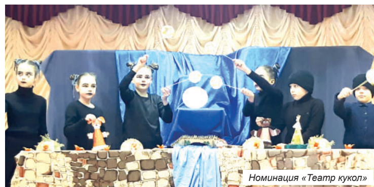
Номинация «Театр кукол»

ческом коллективе взаимозависимы предполагают взаимность, наличие ответного положительного отношения: уважения, симпатии, доброжелательности, оказания помощи и поддержки, предполагают учет интересов, мнений и позиций каждого. Добрые отношения и взаимопонимание между детьми, между педагогом и детьми, создание комфортных условий