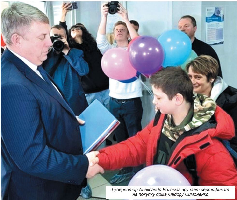
Губернатор Александр Богомаз вручает сертификат на покупку дома Федору Симоненко