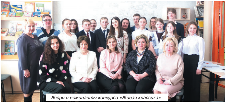
Жюри и номинанты конкурса «Живая классика».

Читают ли наши дети? Знают ли они классическую литературу? Интернет и компьютерные игры занимают практически всё свободное время современных подростков. Чтобы остановить эту негативную тенденцию, необходимо помочь ребятам открыть увлекательный мир художественного чтения. Решить такую задачу в масштабах огромной страны призван Всероссийский конкурс юных чтецов «Живая классика» - самый масштабный проект для школьников нашей страны. Первый этап - школьный, проходил в феврале. Его победители приняли участие в районном этапе, состоявшемся 10 марта в межпоселенческой центральной библиотеке Брянского района.