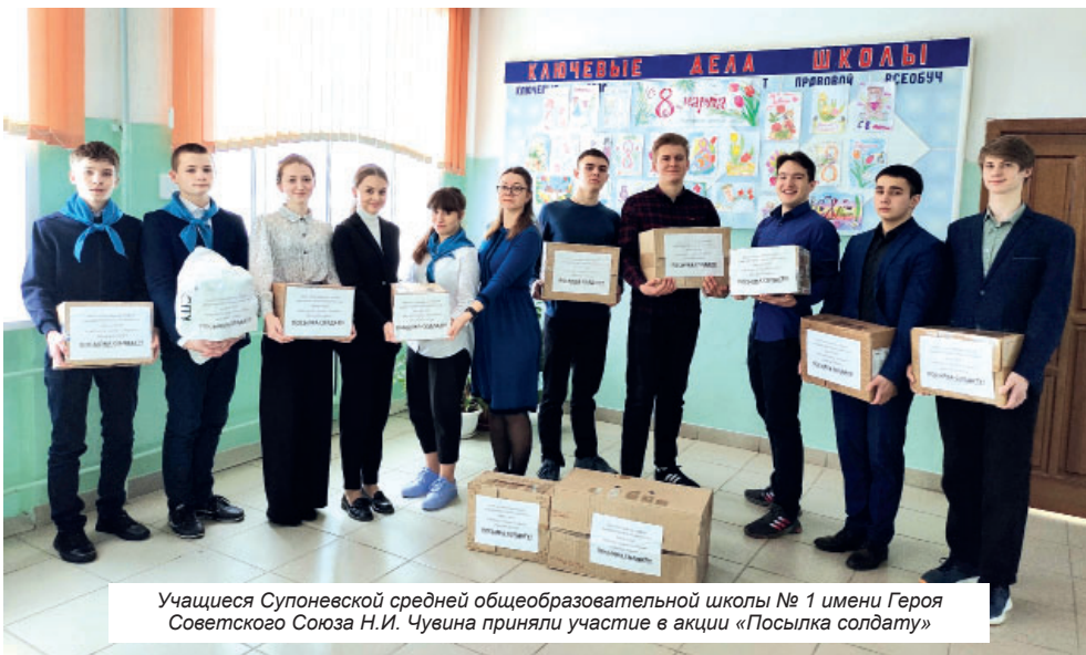
Учащиеся Супоневской средней общеобразовательной школы №1 имени Героя Советского Союза Н.И. Чувина приняли участие в акции «Посылка солдату»

В рамках воспитательной работы, а также работы над социальным проектом в Супоневской средней общеобразовательной школе №1 имени Героя Советского Союза Н.И. Чувина с начала учебного года проходили добровольческие акции, направленные на помощь общественности. Традиционно в школе прошла сладкая ярмарка. На собранные деньги были куплены сладкие подарки для воспитанников ГБУСО «Социальный приют для детей и подростков Брянского района». Учащиеся совместными усилиями организовали сбор подарков к Новому году для детей Донбасса. В рамках волонтерской работы провели мастер-класс для воспитанников Супоневской школы-интерната. В рамках Всероссийской акции «Добрые письма», которую запустило Российское движение школьников, ребята отправили и продолжают отправлять