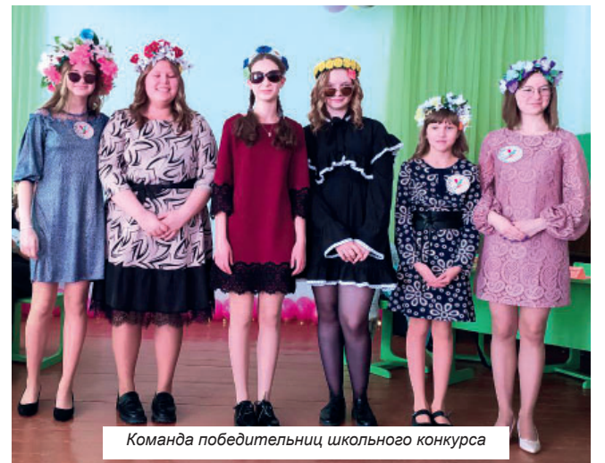
Команда победительниц школьного конкурса