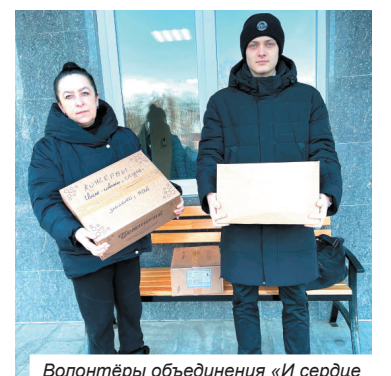
Волонтеры объединения «И сердце делим пополам» МБОУ «Снежская гимназия» Брянского района передали посылки и письма солдатам СВО