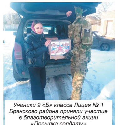
Ученики 9 «Б» класса Лицея № 1 Брянского района приняли участие в благотворительной акции «Посылка солдату»

Воспитанники МАДОУ детский сад «Дружба» участвуют в акции «Письмо солдату». Дети вместе с воспитателями сделали открытки для защитников Родины, которые сейчас находятся на передовой.