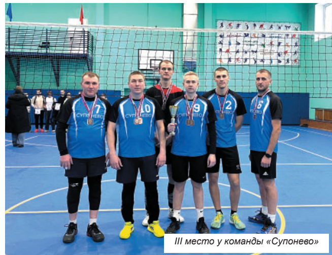
III место у команды «Супонево»