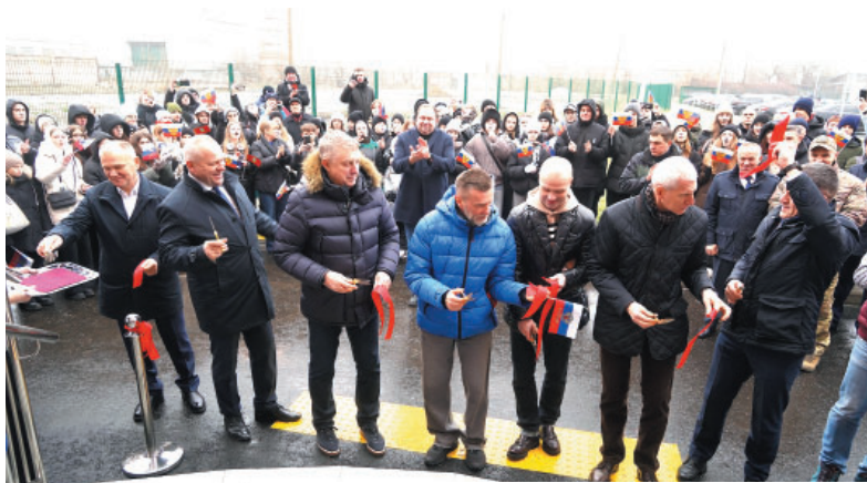
Торжественное открытие Дворца зимних видов спорта «Патриот» имени В. Боброва