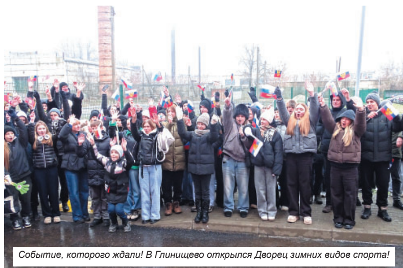
Событие, которого ждали! В Глинищево открылся Дворец зимних видов спорта!