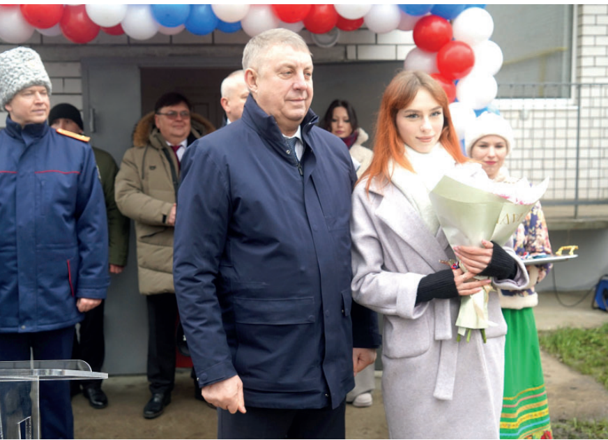
грамму успешно выполняем. В этом году почти 500 детей-сирот станут новоселами», - сказал глава региона. По материалам пресс-службы Губернатора и Правительства Брянской области.