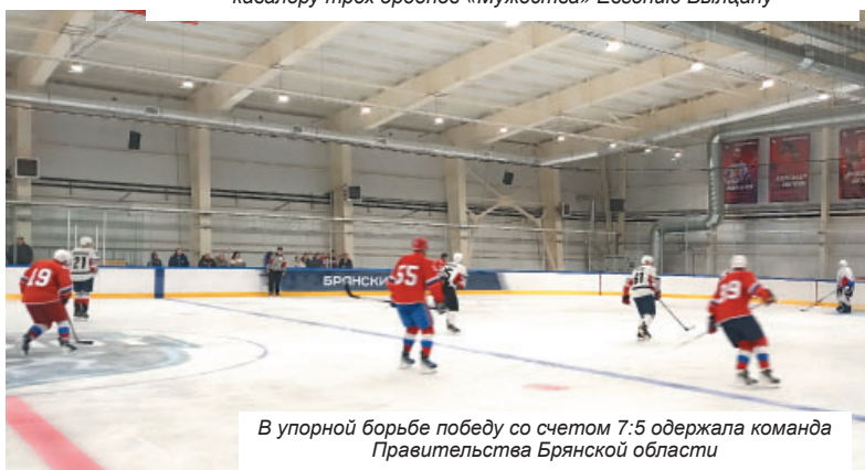
В упорной борьбе победу со счетом 7:5 одержала команда Правительства Брянской области