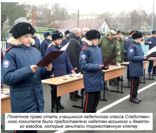
Почетное право стать учащимися кадетского класса Следственного комитета было предоставлено кадетам восьмого и девятого взводов, которые зачитали торжественную клятву

«Место открытия кадетских классов было выбрано не случайно, — сказал в своем выступлении руководитель следственного управления Следственного комитета Рос-