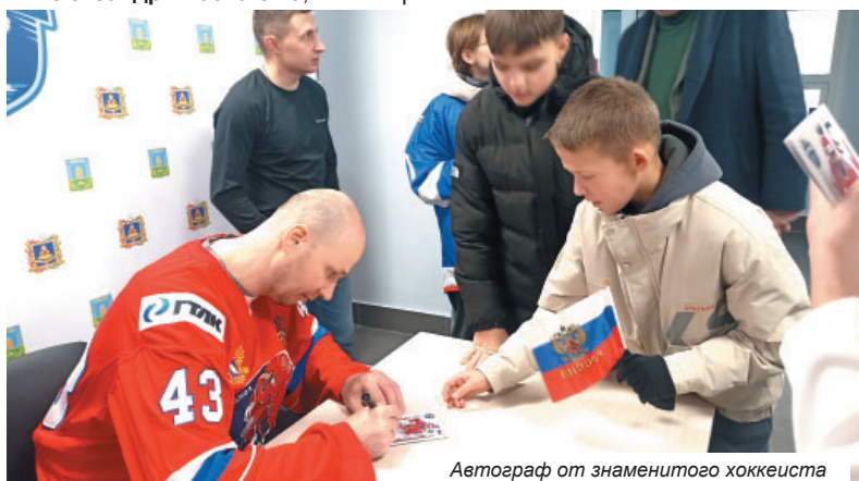
Автограф от знаменитого хоккеиста

С приветственным словом к собравшимся обратился Губернатор Брянской области Александр Богомаз , председатель комитета по физической культуре и спорту Государственной Думы Олег Матыцин и внук Всеволода Михайловича Боброва, известный хоккеист Станислав Александров .